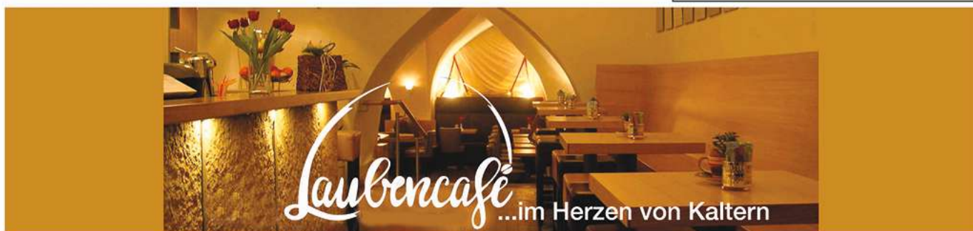
Laubencafé ...im Herzen von Kaltern