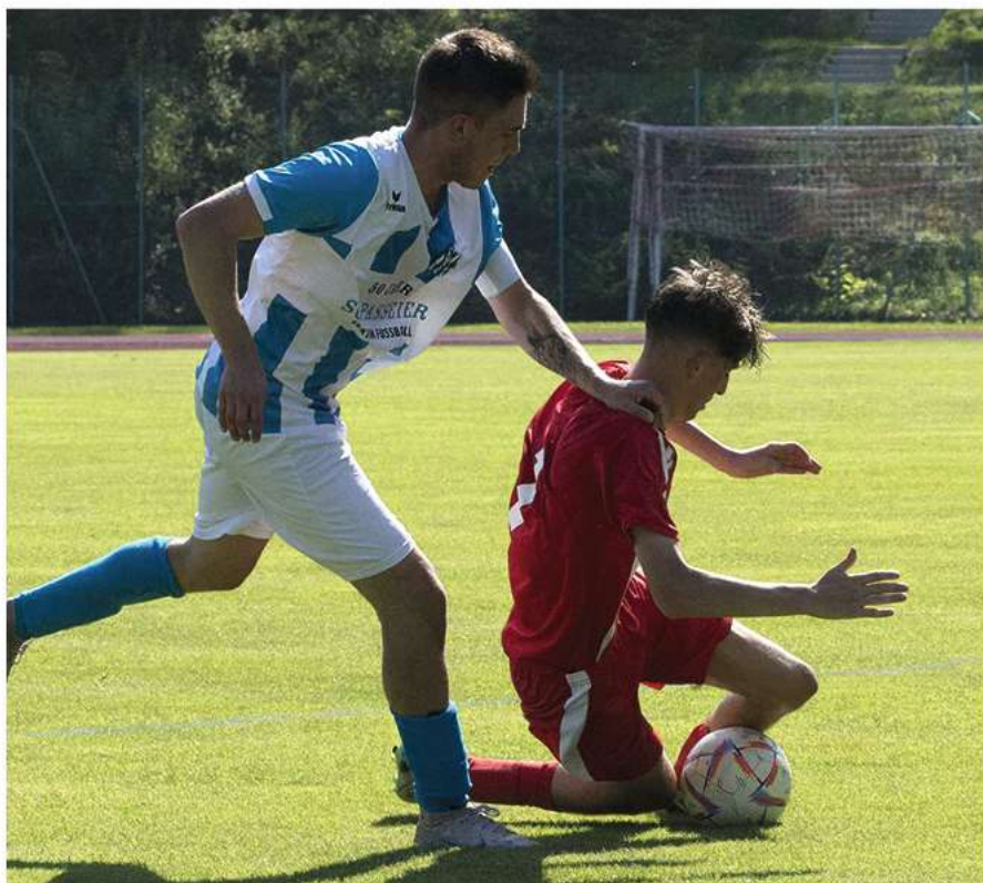
Ein Bild mit Symbolcharakter: SC Passeier obenauf, Kaltern am Boden