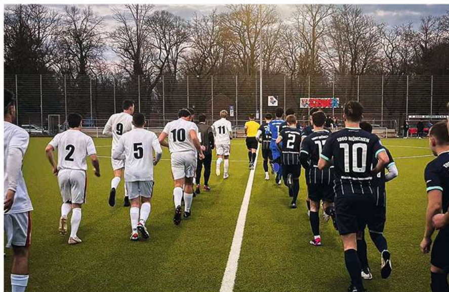
Zu Gast beim Viertligisten der deutschen Bundesliga: 1860 München II